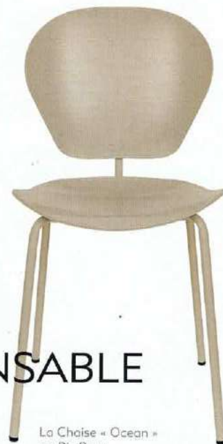
La Chaise « Ocean » en Riz Brun