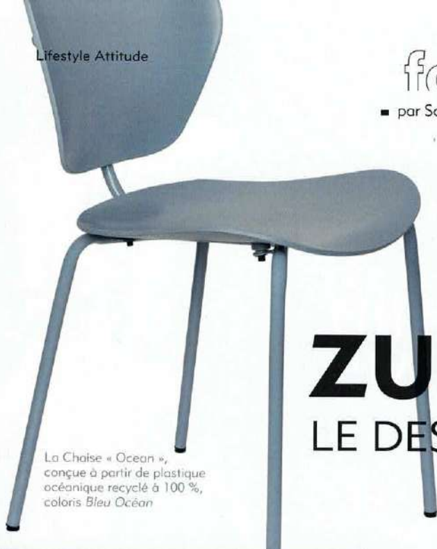
La Chaise « Ocean », conçue à partir de plastique océanique recyclé à 100 %, coloris Bleu Océan